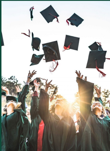
Pendidikan anak terbaik