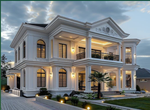
Tempat tinggal layak